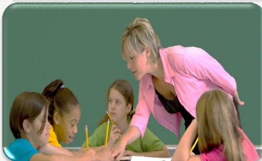
Участие педагогов в ГОУ

Совет по развитию образования Грязовецкого муниципального района