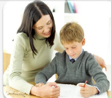
Участие родителей в ГОУ

Школа молодого учителя Грязовецкого муниципального района