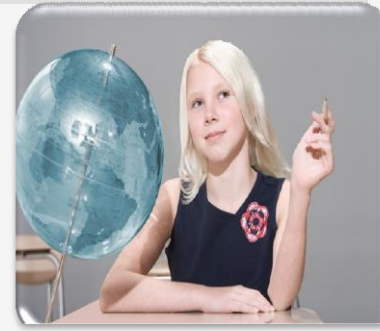
Участие обучающихся в ГОУ

Районное родительское собрание Грязовецкого муниципального района